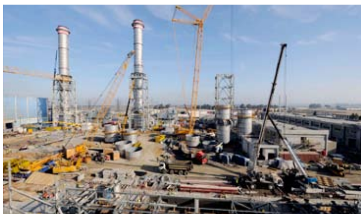
Centrale électrique de Kénitra.

Acteur majeur du BTP au Maroc depuis des décennies, VINCI marque une nouvelle fois le pays de son empreinte en y réalisant deux projets stratégiques et structurants pour le développement du royaume chérifien. Premier d'entre eux : la construction d'une nouvelle usine Renault située à une quinzaine de kilomètres de Tanger et dont la phase 1 a été inaugurée le 9 février 2012 par le roi Mohammed VI et Carlos Ghosn, président de Renault. Quelque 500 km plus au sud, à Kénitra, le second chantier porte sur la réalisation, en groupement avec GE Energy, d'une nouvelle centrale de production d'électricité. Fin juin, après quelques mois d'essais, les installations seront remises à l'Office national de l'électricité (ONE) qui assurera l'exploitation de cette centrale permettant de faire face à des besoins croissants en énergie.